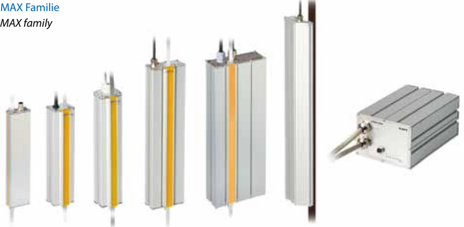
LIMAX Familie LIMAX family

des Elgo S-RMS freihängend im Schacht angebracht. Der integrierte Sicherheitschalter dient zur Bandpräsenzerkennung. Der redundante, SIL3 zertifizierte Sensor LIMAX33 CP erfasst die aktuelle absolute Kabinenposition durch Hallensoren, welche das codierte Magnetband berührungslos abtasten. Durch eine verschleißfreie Kunststoffgleitführung ist der korrekte Abstandsbereich zwischen dem Sensor und dem Magnetband garantiert. Diese Position wird wiederum intern verarbeitet, die Geschwindigkeit und Beschleunigung daraus errechnet und über Sicherheitsrelais in entsprechende Schaltfunktionen umgesetzt.